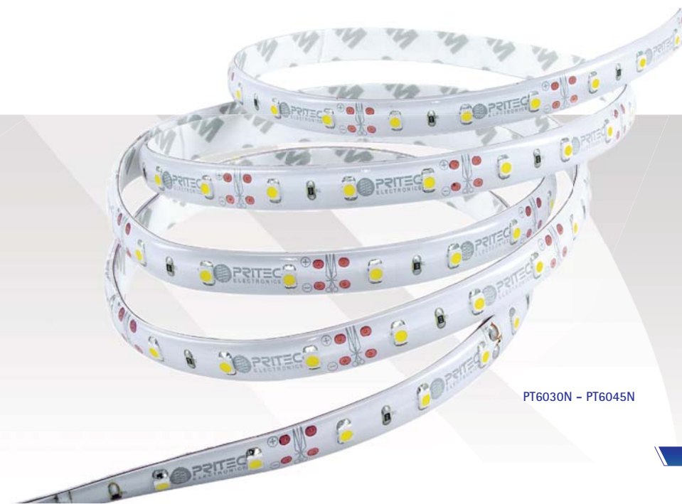
PT6030N - PT6045N

Anywhere, even not accessible, can be illuminated with PRITEC LED strips. With just 3mm thickness, you can install it anywhere and get amazing and elegant results.