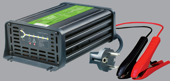
DBC™ - XUNZEL

Cargador de baterías automático de 7 etapas y digital